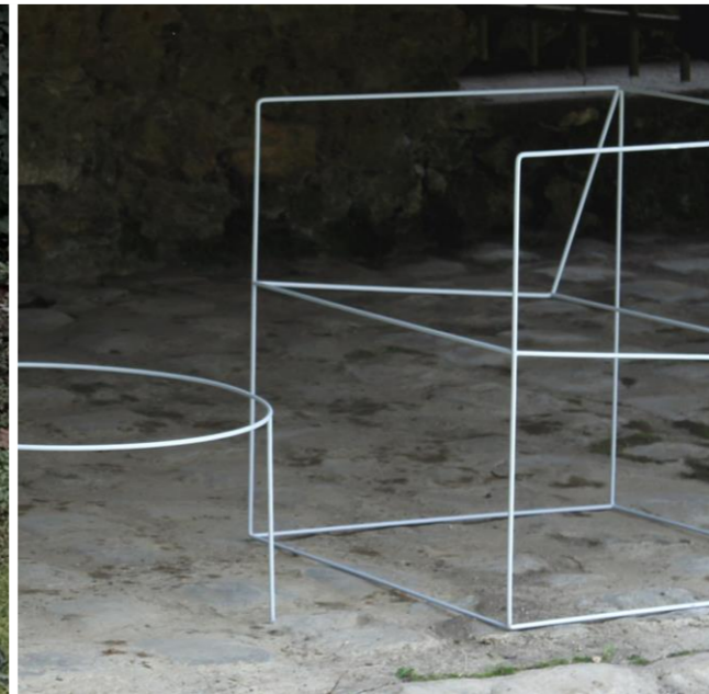
salon Métal, peinture L230 x P60 x H65 cm 2023