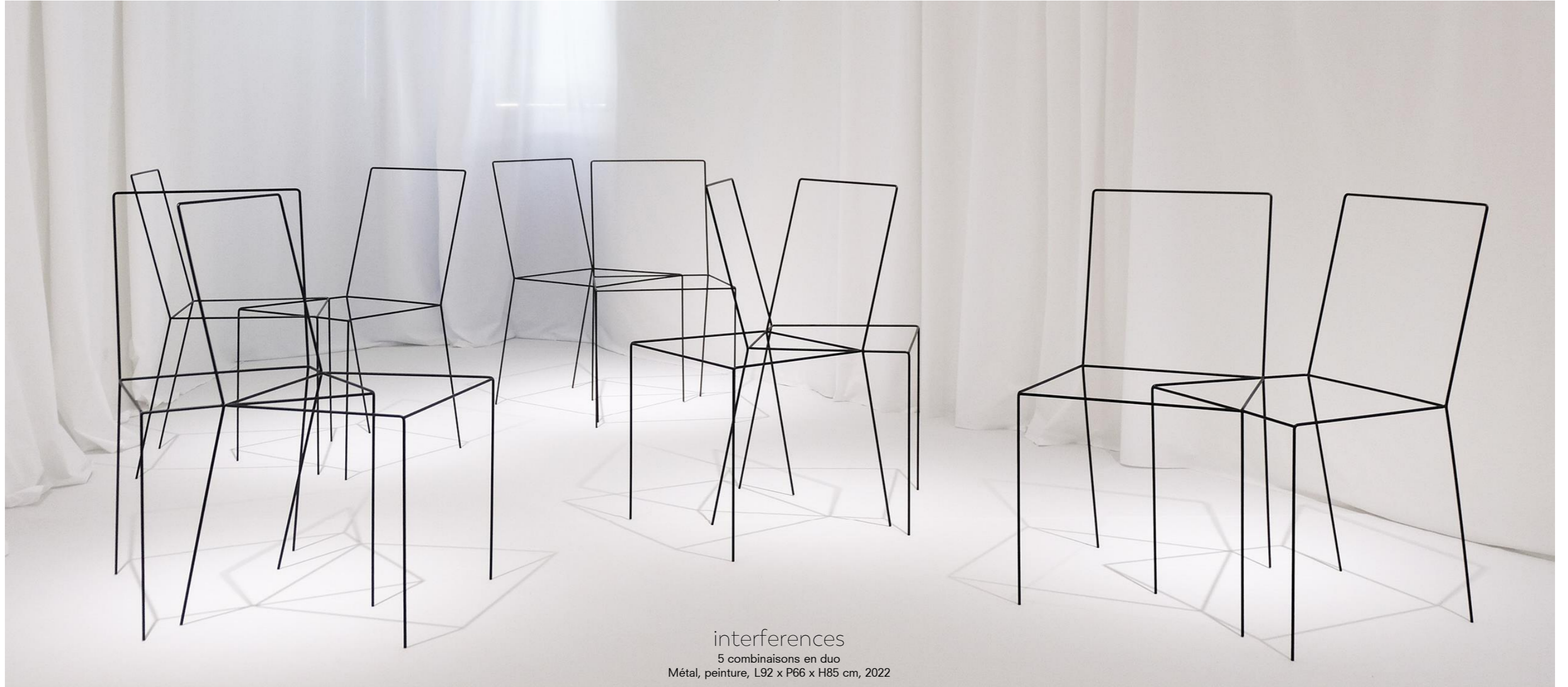
interferences 5 combinaisons en duo Métal, peinture, L92 x P66 x H85 cm, 2022