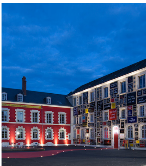
Exposition «Quels ailleurs Quel Trengewekë hna oth » * * Paroles liées.» de Rémi Boinot à la Fondation du Doute