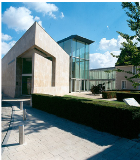
Musée de l'Hospice Saint Roch, Issoudun