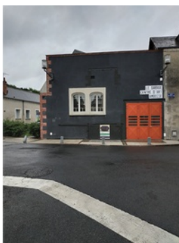
Centre d'art Le Garage

17h-18h : Visite de l'exposition au Garage