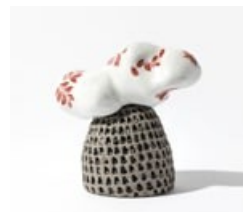
Beatriz Trepap