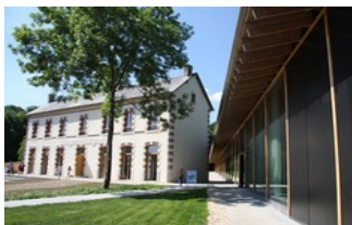
CCC La Borne