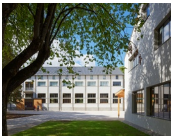
Centre d'art contemporain Les Tanneries